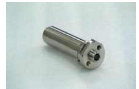
Wireless sensor bottle