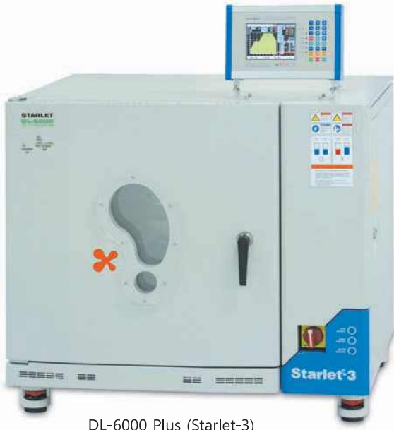
DL-6000 Plus (Starlet-3)