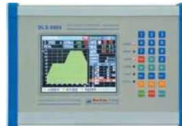
Control panel (Touch)