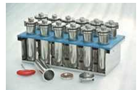
Test bottle & rack